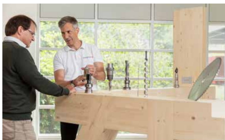
Des professionnels formés pour le conseil à la clientèle dans toutes les régions d'Europe.