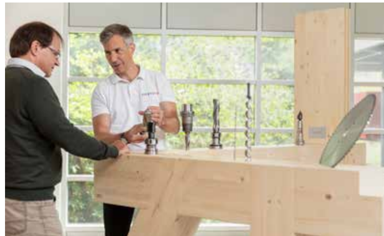
Auf allen Märkten stehen ausgebildete Fachleute zur Beratung zur Verfügung.