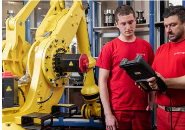
Modernste Produktionsanlagen und ausgebildete Experten garantieren die hohe Präzision und Qualität der Werkzeuge.

Wir verstehen uns als umfassender Partner für die professionelle Holzbearbeitung. Individuelle Werkzeuglösungen für die Produktionsumgebung unserer Kundschaft zählen zu unseren Stärken. Zusätzlich bieten wir auch ein bewährtes Standardprogramm an Werkzeugen für die verschiedensten Anwendungen in der Holzbearbeitung. Auf Wunsch begleiten wir mit Dienstleistungen wie Engineering, Einsatzberatung, Dokumentation, Schulungen sowie vollständiger Projektbetreuung.